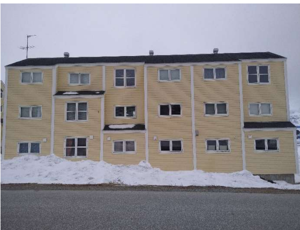
B-2926, Attartu 35-43 NV facade