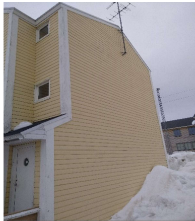
B-2926, Attartu 35-43 NØ gavl