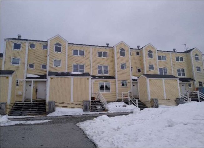
B-2925, Attartu 19-33 SØ facade