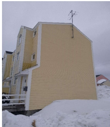
B-2925, Attartu 19-33 NV gavl