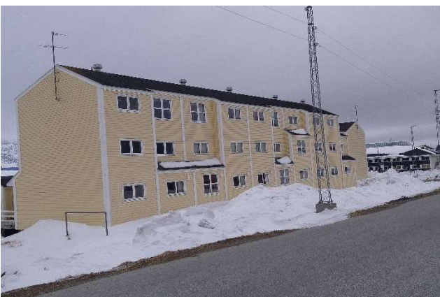
B-2925, Attartu 19-33 NV facade