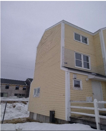
B-2926, Attartu 35-43 SV gavl