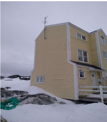
B-2927, Attartu 45-57 NV gavl