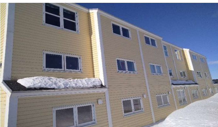
B-2927, Attartu 45-57 NØ facade