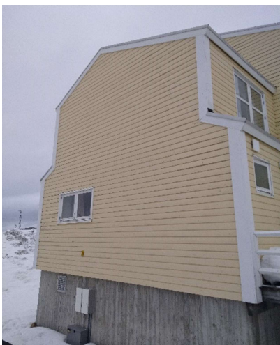
B-2924, Attartu 3-17 SØ gavl