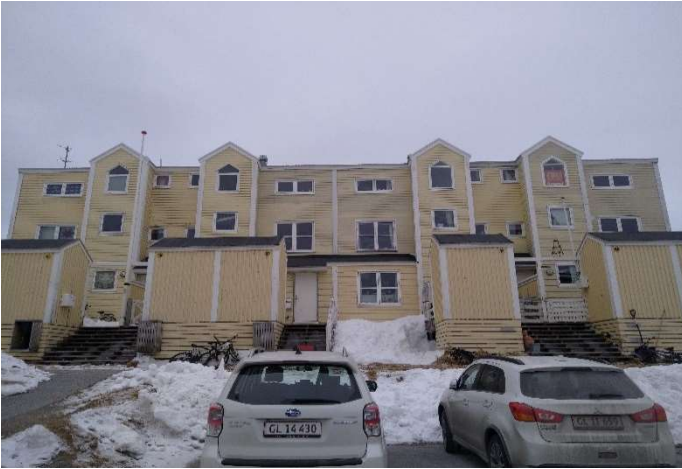
B-2927, Attartu 45-57 SV facade