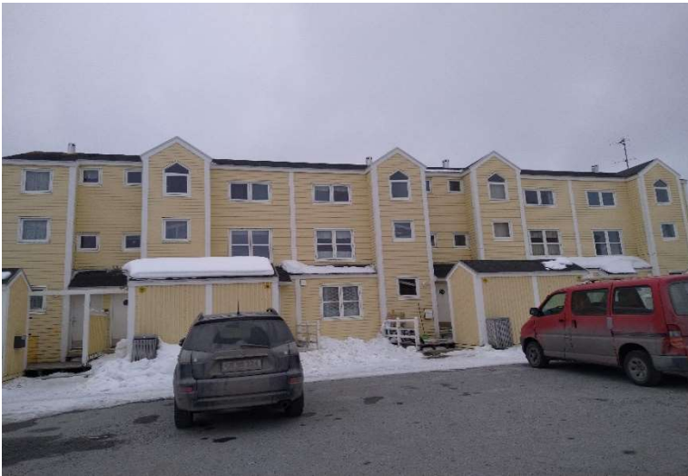
B-2924, Attartu 3-17 NØ facade