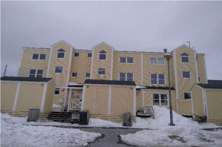
B-2926, Attartu 35-43 SØ facade