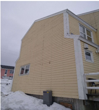
B-2925, Attartu 19-33 SV gavl