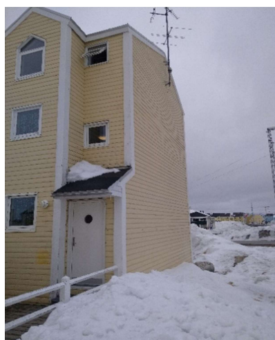
B-2924, Attartu 3-17 NV gavl

- B-2924, Attartu 3-17 Syd Vest facade skal ikke malerbehandles.